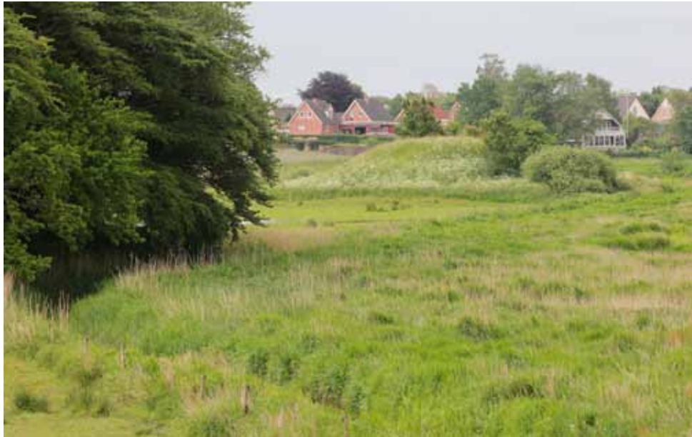
Tovskov Voldsted set fra Lertevej og nordbredden af Ørsted Å med Mølby i baggrunden.