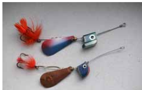
Nederst den oprindelige OT Mörrum, øverst dens efterfølger fra ABU.