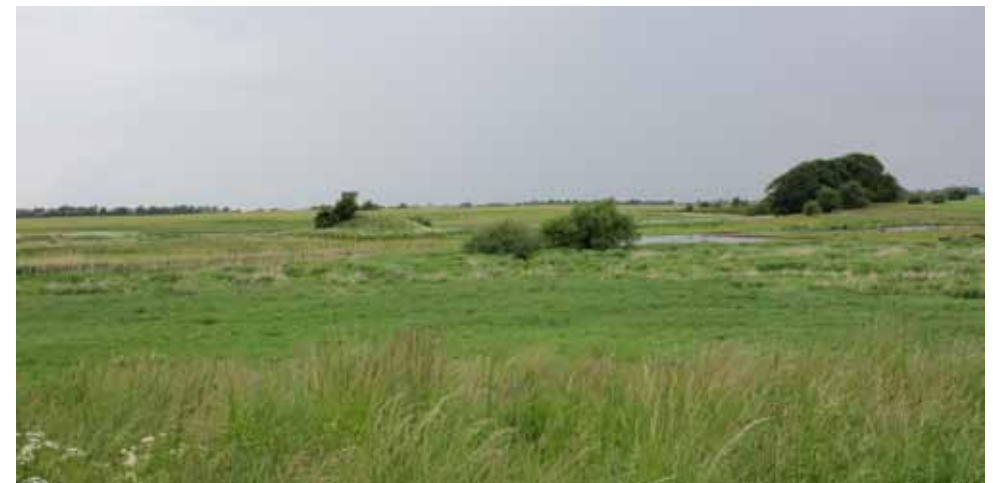
Tovskov fotograferet fra stien fra Mølby ned mod foreningens fiskestrækning af Nørreå.