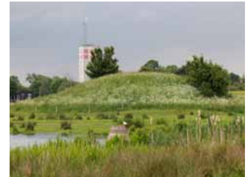
Voldstedet fotograferet med telelinse nede fra Ørsted Å.