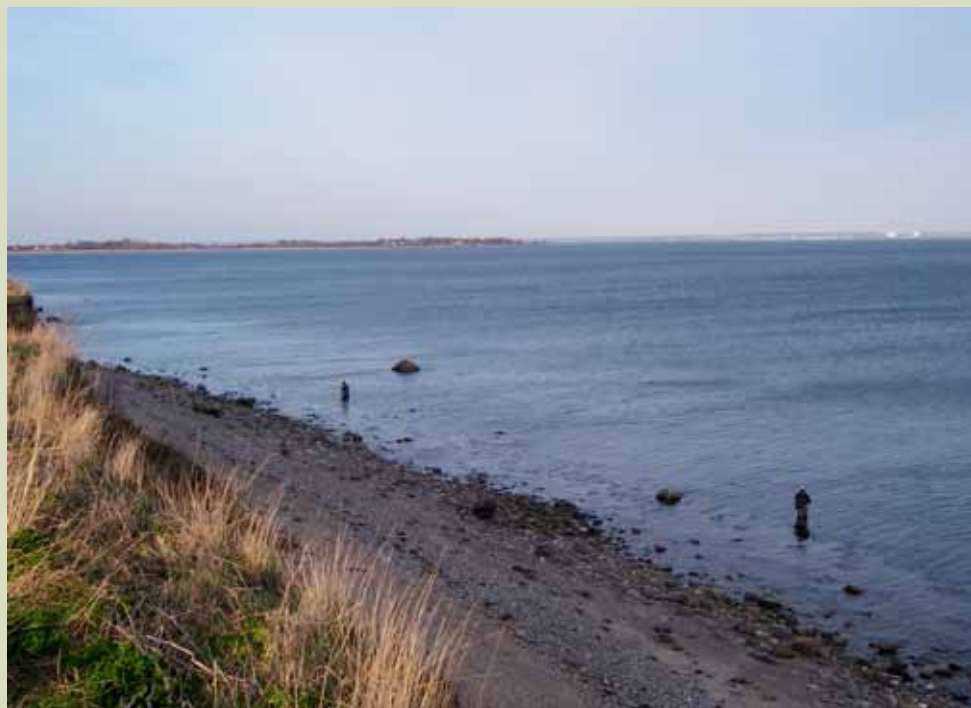
Råde Strand bliver nu et endnu mere attraktivt revir for sportsfiskere.

Før i tiden fandtes mange naturlige stenrev i vores farvande. De opstod under istidens gletchere, der bragte stenene fra Norge og Sverige. Men i løbet af de sidste 100 år blev der opfisket masser af sten til bygning af havne og moler.