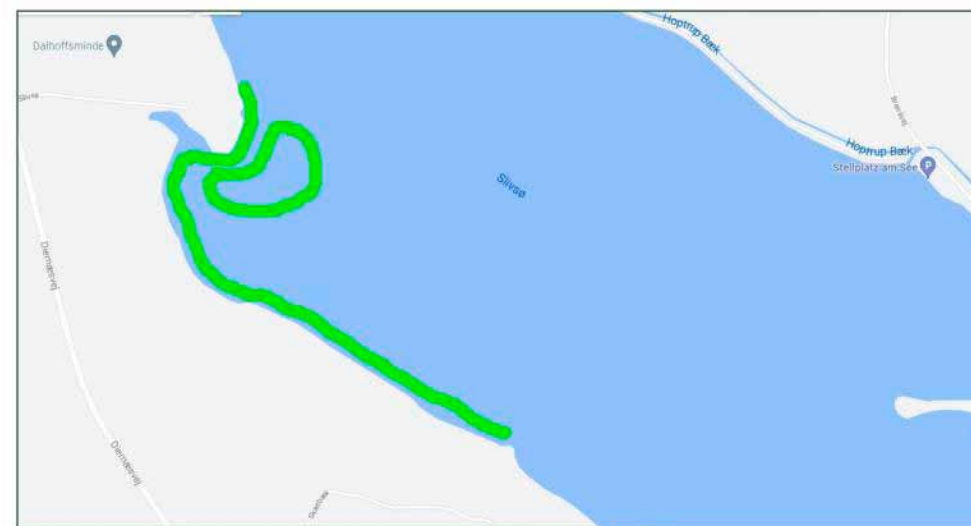
Pilotprojektafgrænsningen. De grønne markeringer er de strækninger hvor SSF vil udlægge nåltræer. På den grønne åbne strækning på ca. 700 meter udlægges skiveskærne nåltræer og i den lukkede grønne cirkel udlægges hele nåltræer.