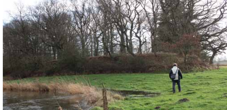
Voldstedet set nede fra Jels Å.

Voldstedet ses dog bedst i den kolde årstid, når træerne på voldstedet har smidt bladene.