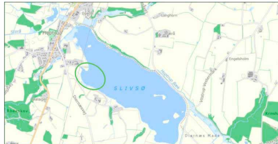
Placeringen delområdet for pilotprojektet i Sliv Sø. Sliv Sø ligger øst fra Hoptrup, 6100 Haderslev. Den grønne cirkel markerer delområde af Sliv Sø hvor naturplejen vil foregå.

Bemærk at det er et pilotprojekt, så hvis erfaringerne er gode, vil vi lave mere af denne slags.