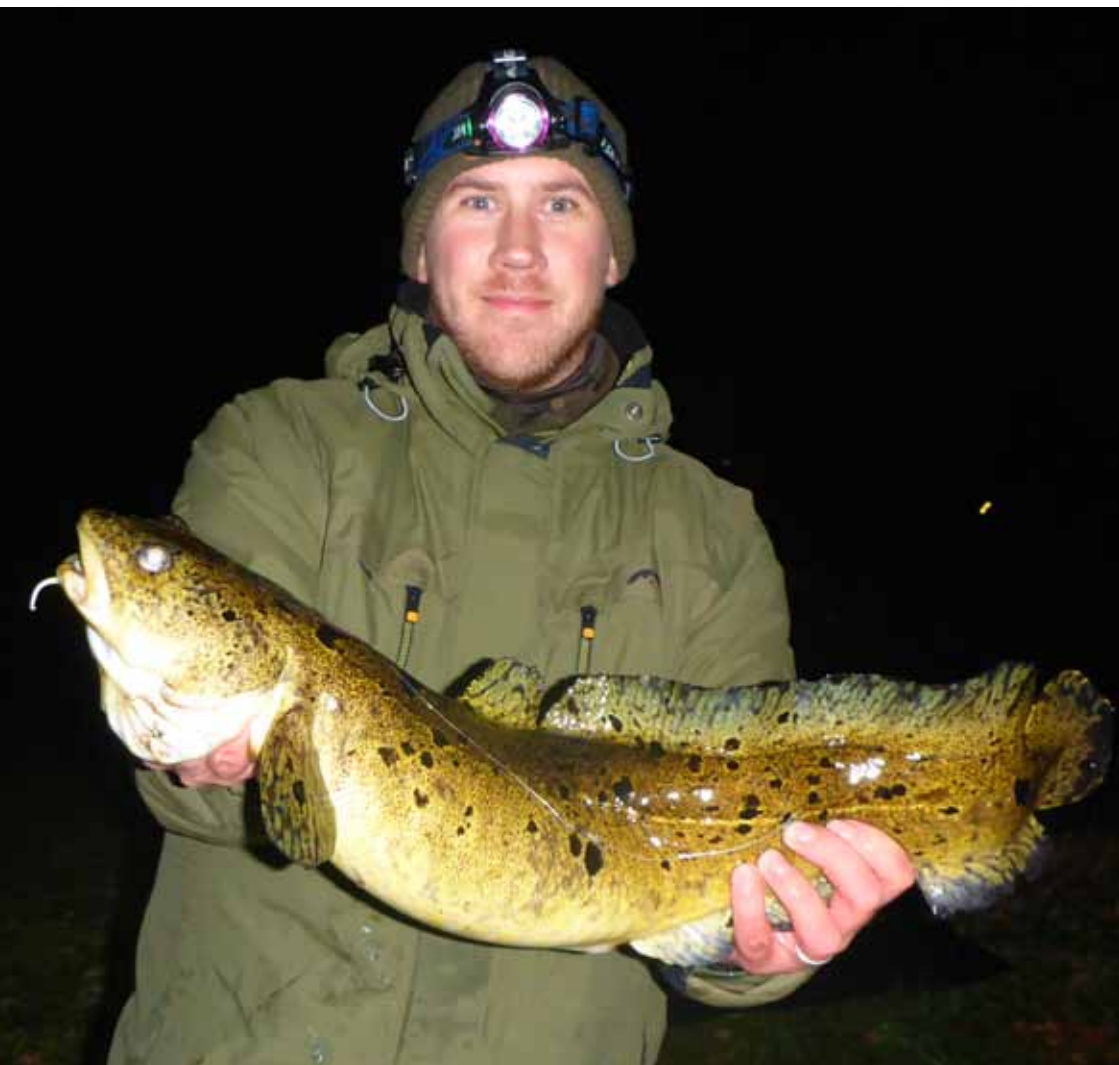
Stor sjællandsk knude fanget ved vinterfiskeri fra bredden af Suså.

set i foreningens vande, idet Isfiskeri er forbudt i Vedbøl Sø, Vedsted Sø og Slivsø og Haderslev Dam – det samme gælder fiskeri med agnfisk. Men mon knuden ikke også med lidt held og sikkert megen tålmodighed kan fristes af kunstige agn. I Nørreå, Gram Å, Fladså og Gels Å, hvor der bevisligt findes knuder, må man nøjes med at friste dem med en stor portion regnorm.