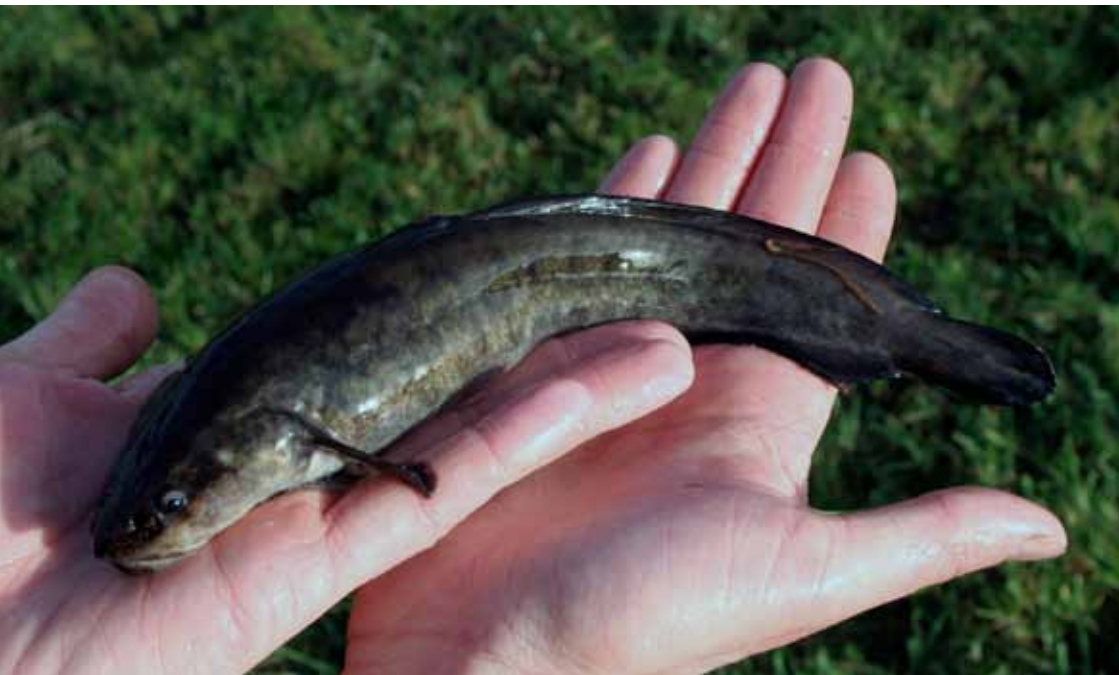
Ung knude fanget ved elektrofiskeri i et lille tilløb til Gram.

Det er nok kun de færreste, som har fanget en knude her i området og da slet ikke ved målrettet fiskeri. Nogle af foreningens vandløb huser dog de særprægede rovfisk.