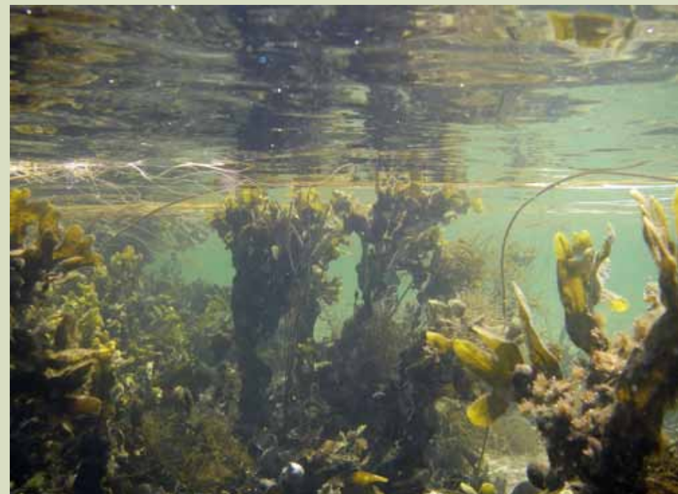
Tangplanter kræver et fast voksested og sikrer til gengæld skjul for mange dyr.