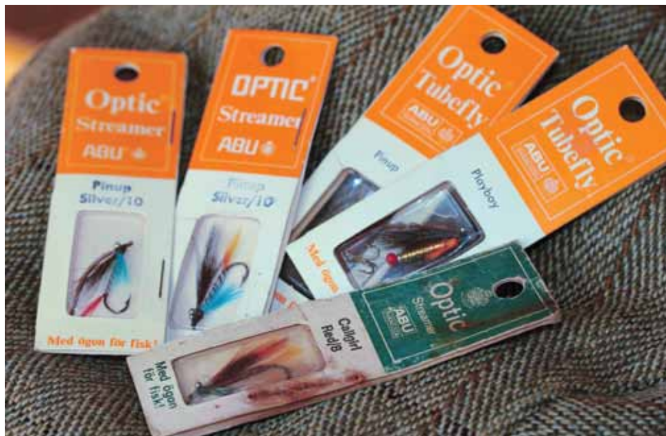
Udvalg af Optic fluer med tilbagestrøget hår, udstående øjne og sexede navne.

Til trods for, at min sunde fornuft klart afviste det der med fluesnak – så tænkte jeg, at jeg nok burde gøre noget for at genoptage kontakten. Det var ikke helt let.