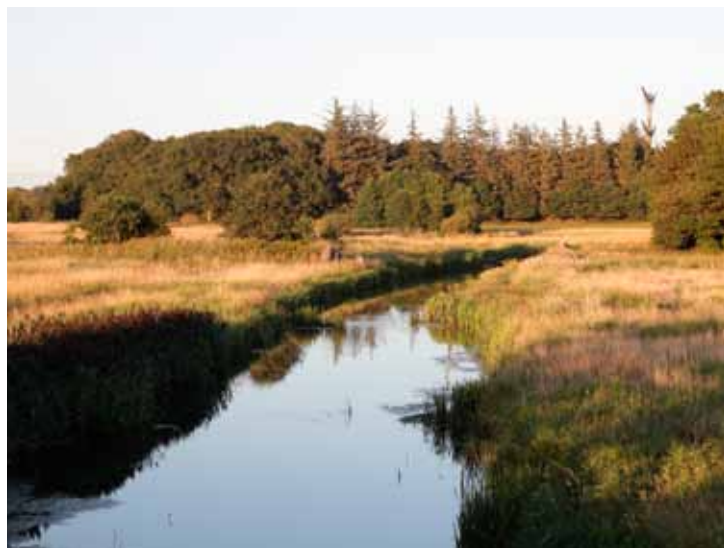
Den træbevoksede Kongens Holm anes lidt til venstre for grantræerne. Mellem broen og den træbevoksede bank strømmer den mindre Jels Å ud i Nørreåen. Set oppe fra landevejsbroen.

1) Vi kan starte udflugten med at parkere bilen på p-pladsen i højre side af A25-landevejen mellem Nustrup og Øster Lindet. Oppe fra landevejsbroen ses ca. 150 meter mod øst resterne af en gammel jernbanebro samt sammenløbet af Jels Å og Nørreå. Voldstedet Kongens Holm skimtes fra vejen som en træbevokset lille høj 400 meter længere oppe.