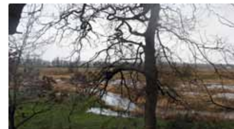
Udsigt oppe fra Kongens Holm over engen ned til Jels Å.

Mod nord, vest og syd er den omgivet af engene langs de to åer, mens den tørre voldgrav, der er 8 meter bred og over 2 meter dyb, mod øst adskiller den fra landtangen. Her kan selv gården have ligget, men der er ikke spor i skoven efter voldgrave og lignende. Gården kan også være blevet liggende i landsbyen Mojbøl, og selv fæstningen anlagt som en sikkerhed i tilfælde af, at der skulle blive nødvendigt at forlade gården i ufredstider. Der kendes intet til stedets historie, men ifølge en præsteindberetning fra 1809 fandtes der da både kampe- og mursten på banken. I dag kan der opsamles teglstumper på steder, slutter Lennart Madsen sin beskrivelse i bogen, der kan bestilles hjem hos Biblioteket eller købes antikvarisk.