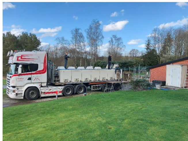
Læsning af smolt fra damme ved klækkehuset.

PE-holdet, og resten med en fisketransport-lastbil.