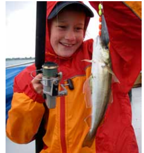
Sød fiskepige med hvilling på Lillebælt.

Ved tiltagende længde får hvillingen en sund appetit på småsild, fiskeyngel og endda mindre artsfæller. Nu jager den både ved bunden og pelagisk midt i vandsøjlen, blot menukortet falder i dens smag.