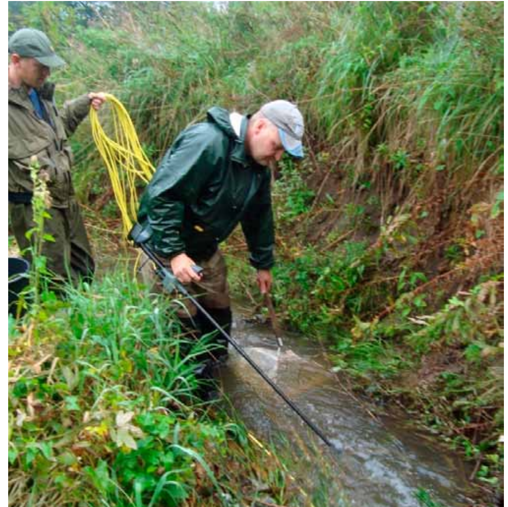
Det er kun de udvalgte som får lov at holde styr på ledningen. En prøve skal bestås først.

Mange faktorer indgår i, at kunne udregne hvor mange fisk det aktuelle vandløb, på det aktuelle sted kan bære. Mange visuelle indtryk noteres, bl.a. bredder, dybder, skjul, beplantning og selvfølgelig en umiddelbar vurdering af vandets kvalitet. I 2011 blev der på 84