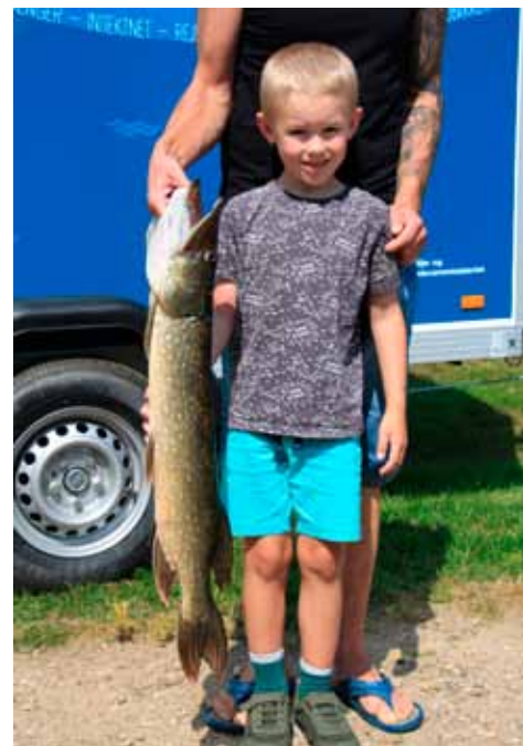
Konkurrencens vinder.

Fiskeekspressen var med til konkurrencen for at gøre reklame for det lystfiskertiltag som Regeringens Sommerferiepakke »Sommer i Danmark« under initiativet »Bedre muligheder for lystfiskeri« er sat i søen for. Formålet er, at undersøge om muligheden for at låne gratis udstyr – og få hjælp til at fiske, kan få flere til at blive lystfiskere. Projektet er finansieret af Miljø- og Fødevarerministeriets naturmålsmidler.