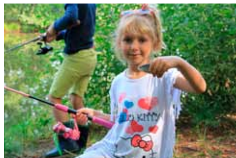
Stolt fisker med fangst.

Danmarks Sportsfiskerforbund og lokale sportsfiskerforeninger står for driften af Fiskeekspressen. Fiskeekspressen er et landsdækkende tilbud om udlån af grej til familier, foreninger, skoler, dagtilbud og andre grupper, der vil ud at fiske.