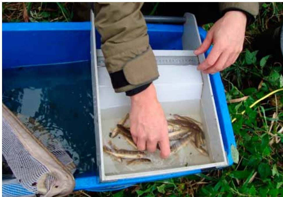
Alle fisk noteres og ørreder måles.

Det er meget lærerigt, så jeg kan virkelig anbefale at man melder sig. Har man kun mulighed for at hjælpe en enkelt dag, så er det også fint. En god mulighed for at få mange fisk i hænderne!