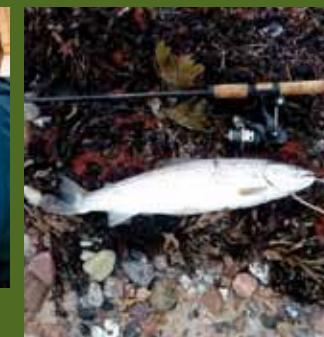
Turlederens vinderfisk fra 2019.