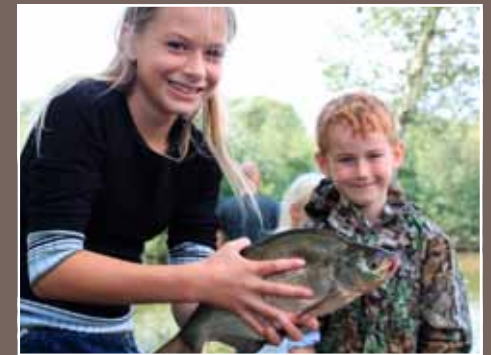
Billeder fra fiskekonkurrencen for skolebørn i Fuglesøen