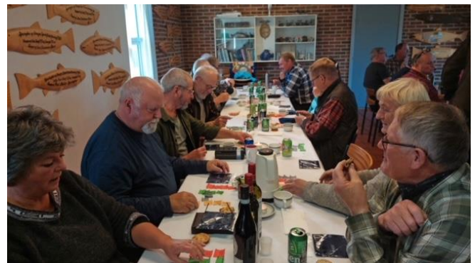
Gule-ærter-konkurrence 2022.