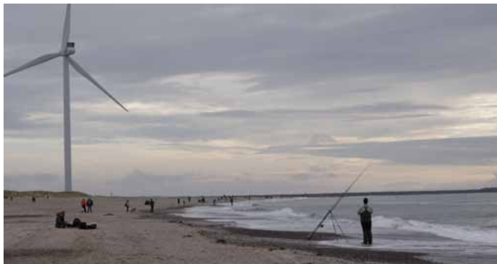
Stranden nord for Hvide Sande ved de tre kæmpe store vindmøller.