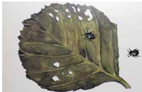
Bladbiller og andre insekter spiser af de grønne elleblade. Men på en eller anden måde er det kontrolleret, så bladet stadig er stort nok til at have en tilstrækkeligt fotosyntese.

Mange insekter minerer bladene, det vil sige, de gnaver kun bladens indre, men beskyttes af blad huden. De sørger dog for at aflevere ekskrementerne udenfor. En af de mest særprægede er sækmøl-larvernes ( Coleophora ) mine: Larven lever, næsten som en vårfluelarve i et lille hus. Det hænger som en pølse på bladets underside og fra huset spiser larven så meget fra bladets indre, som den kan nå.