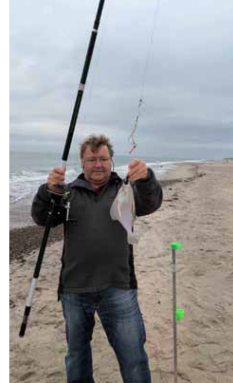
Fladfisk som denne skrubbe yder bestemt ikke nogen uforglemmelig fight på dette kraftige grej, men kan lokkes til hug ude over 100 meter fra land.

På dage med kraftigere vind og brænding kan det blive nødvendigt med tungere lodder for at holde bunde. Fastspolehjulet skiftes så ud med et multiplikatorhjul som for eksempel et Ambassadeur 7000, som giver bedre kontrol under kastet, skåner pegefingern og giver mere kraft i indspinningen.