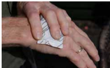
Hurtig smertelindring og behandling af fjæsingstik med Termopad.

Fisker man langs kysterne omkring Kattegat, vil man før eller siden få en eller flere fjæsinger på krogen. Er man nu så uheldig at blive stukket på en af dens giftige pigge på gællelåget eller i forreste rygfinne vil man straks opleve meget intense smerter i området. Normalt anbefales så af holde hånden nede i mindst 45-50 grader opvarmet vand. Varmen neutraliserer giften og smer-