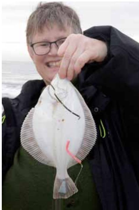
Skrubbe fanget lige udenfor brænding nær land.

diskene er alle lystfiskere med fingeren på pulsen og er ikke karrige med at give aktuelle tips til fiskepladser.