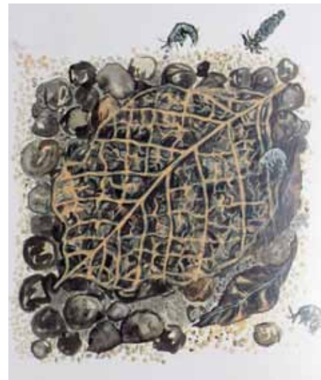
Ferskvandtangler har skeletteret et elleblad.

Det gør ellebladene mere værdifulde som føde for smådyrene. Man kan for eksempel se, at bækkens slørevingelarver foretrækker døde elleblade frem