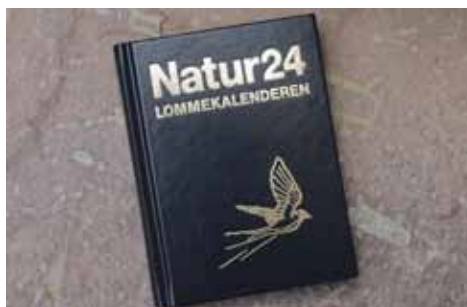
Denne artikel gengives med venlig tilladelse af Bent Lauge Madsen. Den blev 2013 bragt i Natur-lommekalenderen udgivet af forlaget Rhodos.

Undersøgelserne var så grundige, og resultaterne så overbevisende, at der i den nye vandløbslov (1982) kom en ny paragraf (§34) om elletræer. Underligt at man i de aktuelle vandplanter overhovedet ikke har gennemtænkt de muligheder. Måske er det på tide at tage dem op igen?